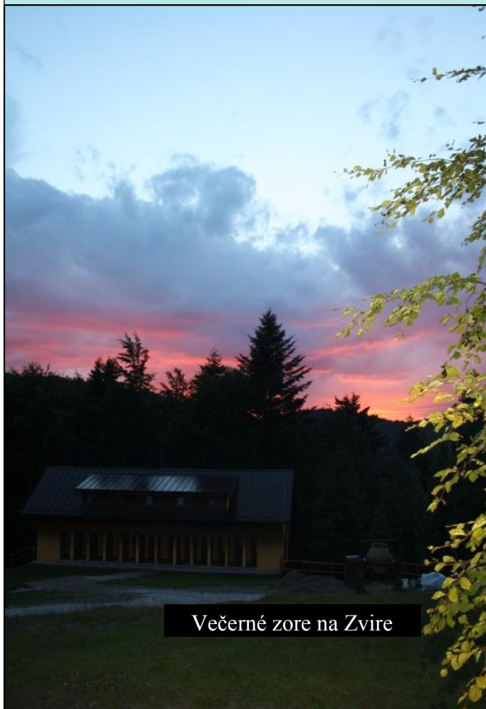
Večerné zore na Zvire

Milí pútnici, milí čitatelia elektronickej podoby našich Zvestí, všetci Bohom milovaní bratia a sestry v Kristovi.